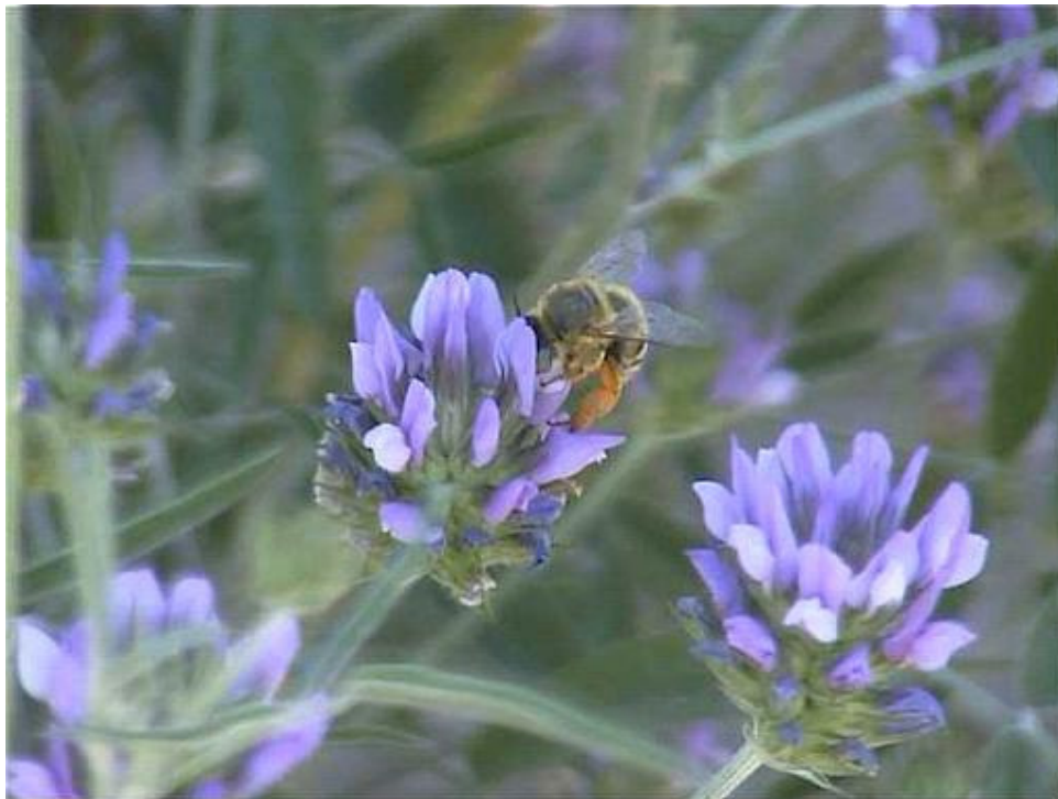
Detalle de Bituminaria bituminosa .