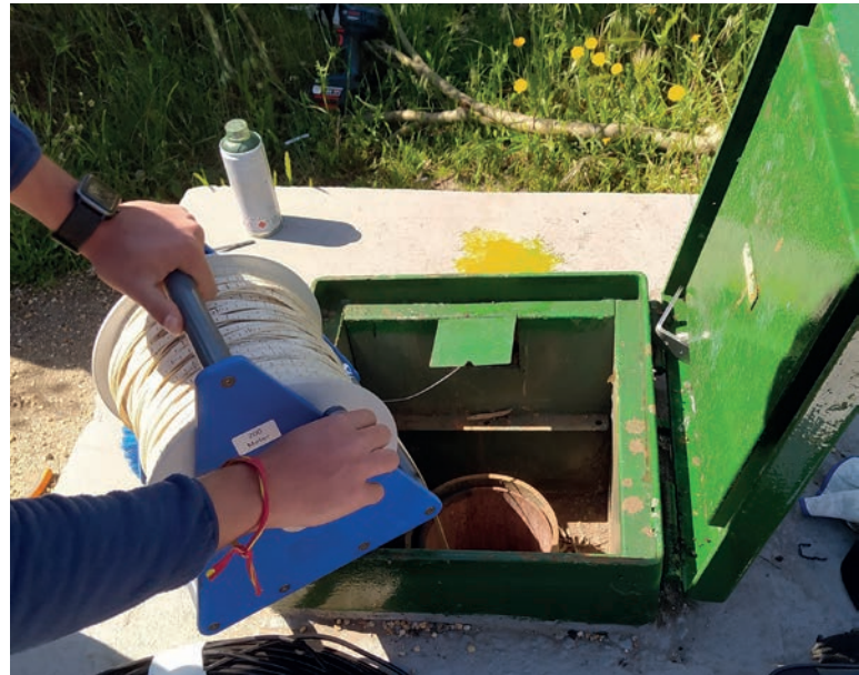
Medición manual del nivel piezométrico