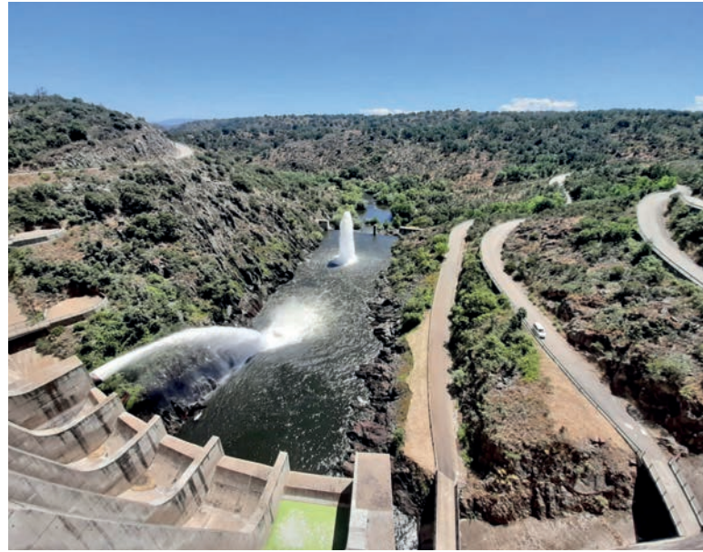
Embalse de Iruña, cuenca del Duero (Salamanca, Castilla y León)