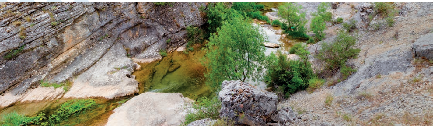
Reserva Natural Fluvial del río Dulce, cuenca del Tajo (Guadalajara, Castilla-La Mancha)