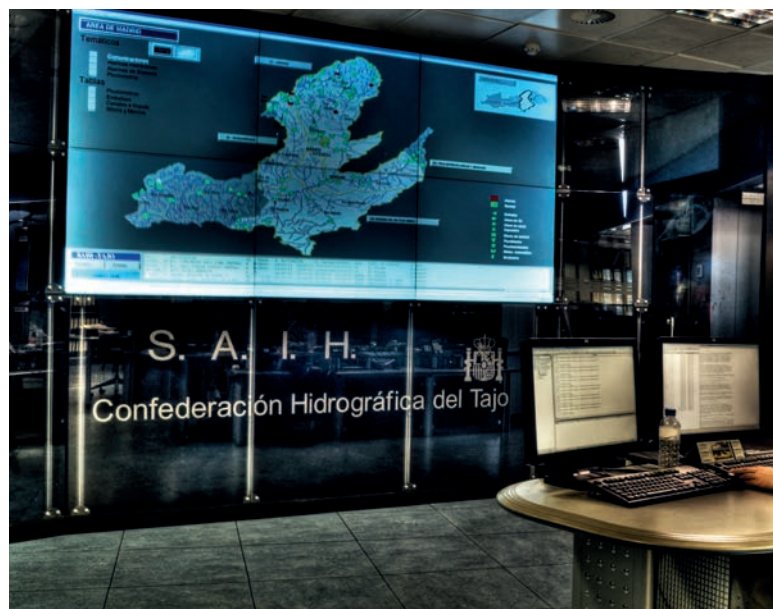
Imagen del Sistema Automático de Información Hidrológica (SAIH) de la Confederación Hidrográfica del Tago