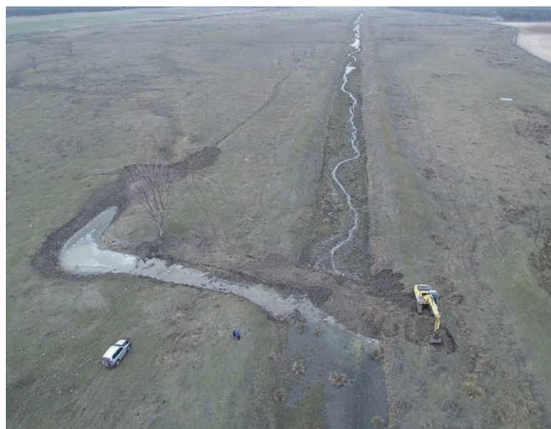
Restauración fluvial del río Zapardiel en la cuenca del Duero