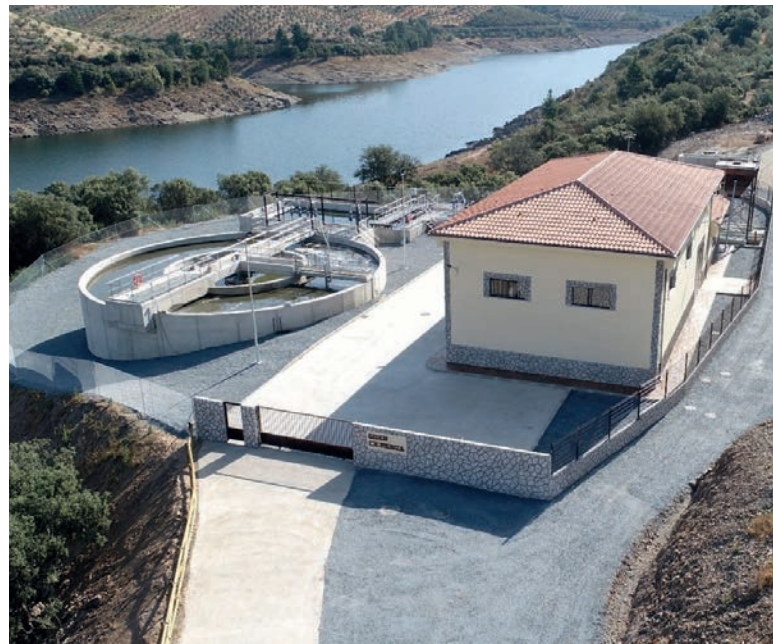
EDAR La Pesga, cuenca del Tajo (Cáceres, Extremadura)