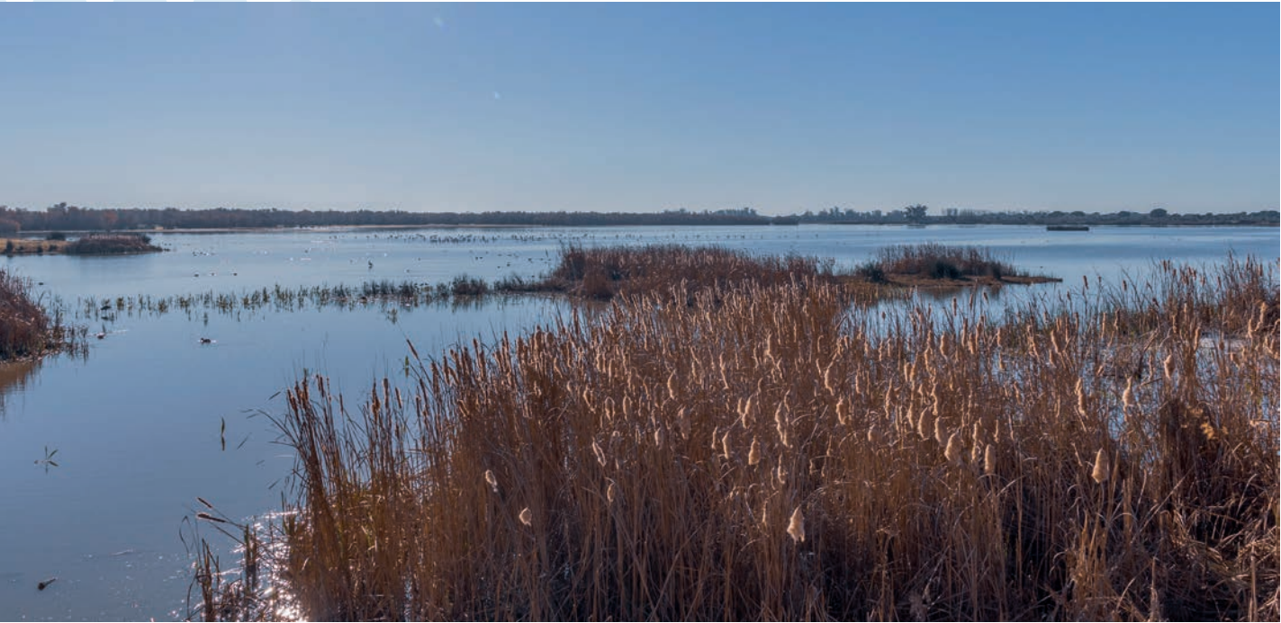
Parque Nacional de Doñana, cuenca del Guadalquivir, en la provincia de Huelva (Andalucía)