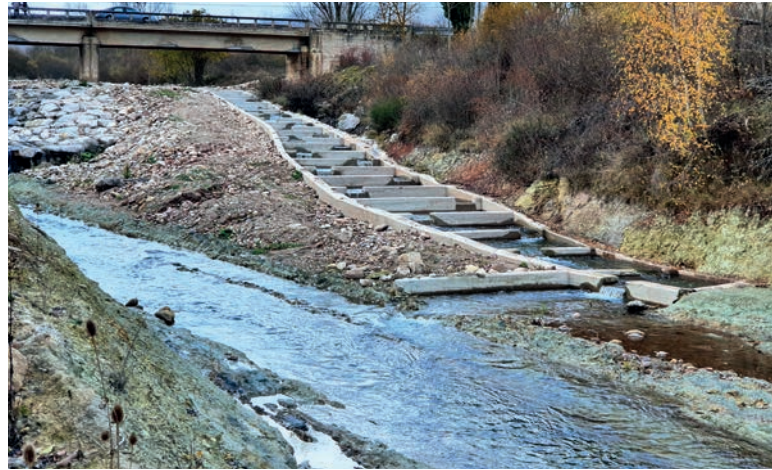
Escala de peces construida por la Confederación Hidrográfica del Ebro en el río Híjar (Cantabria)