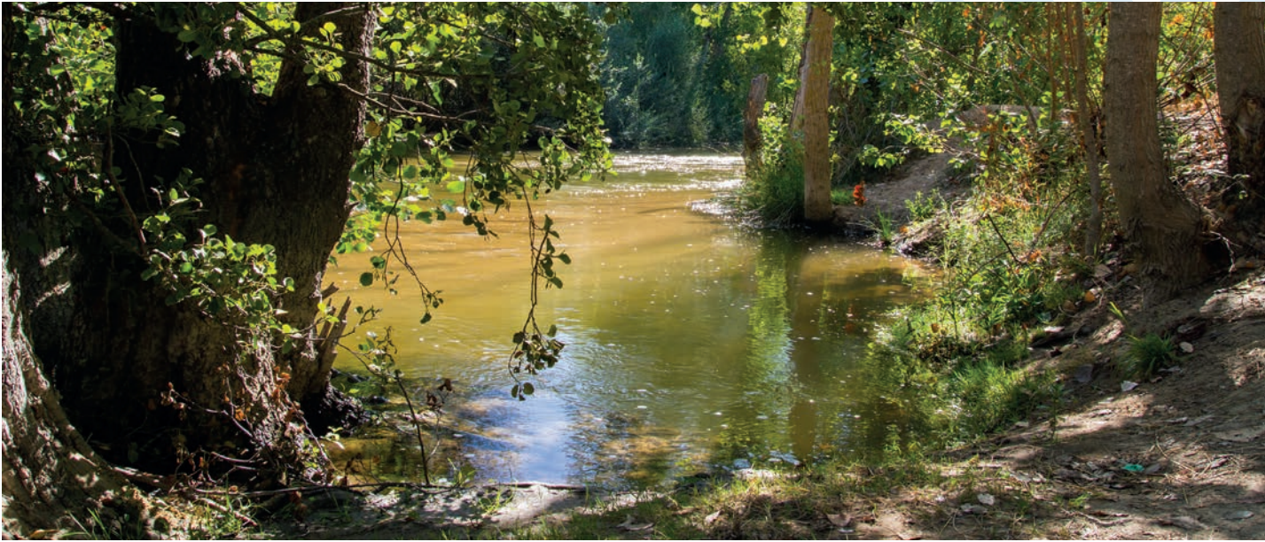
Río Alberche en la cuenca del Tajo (Toledo, Castilla-La Mancha)