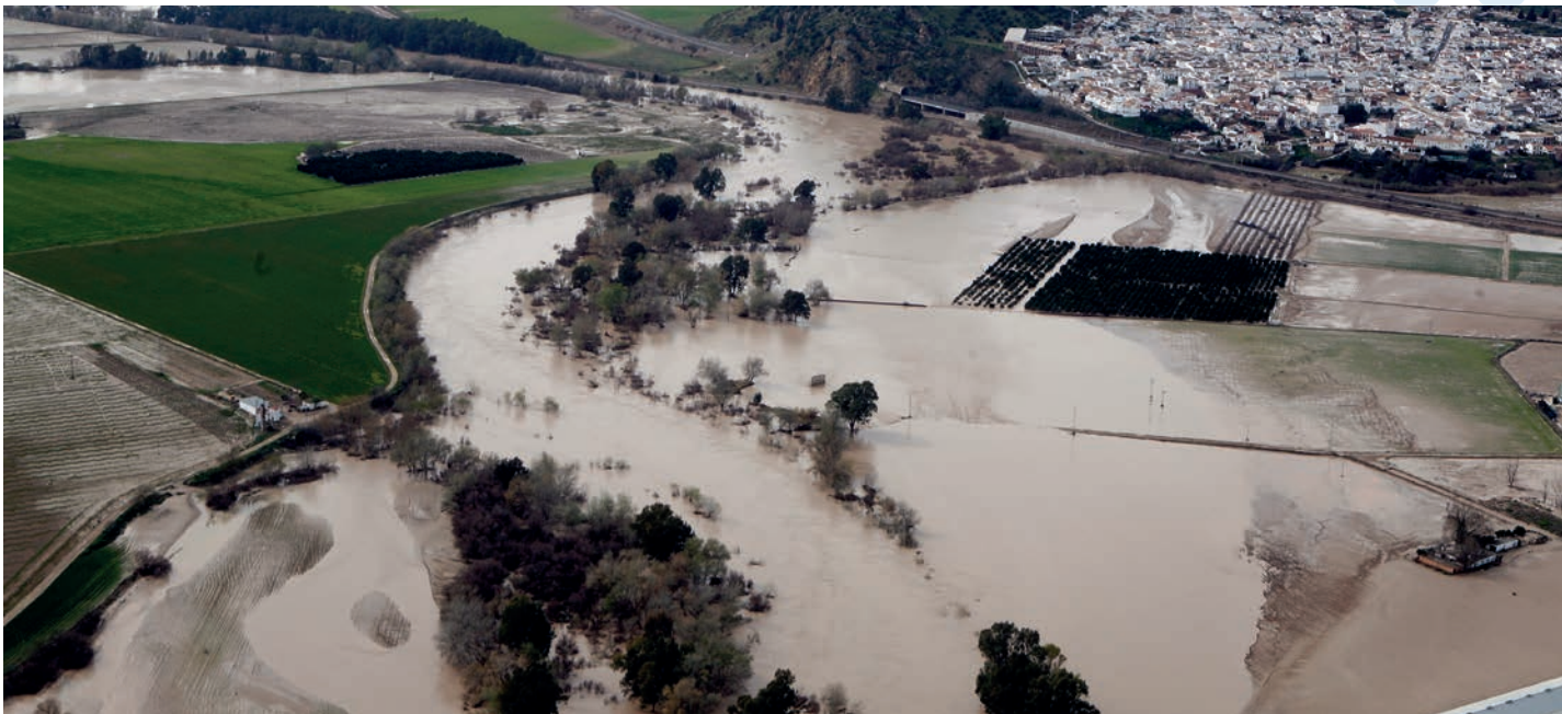
Inundaciones de 2010 en Almodóvar del Río (Córdoba, Andalucía)