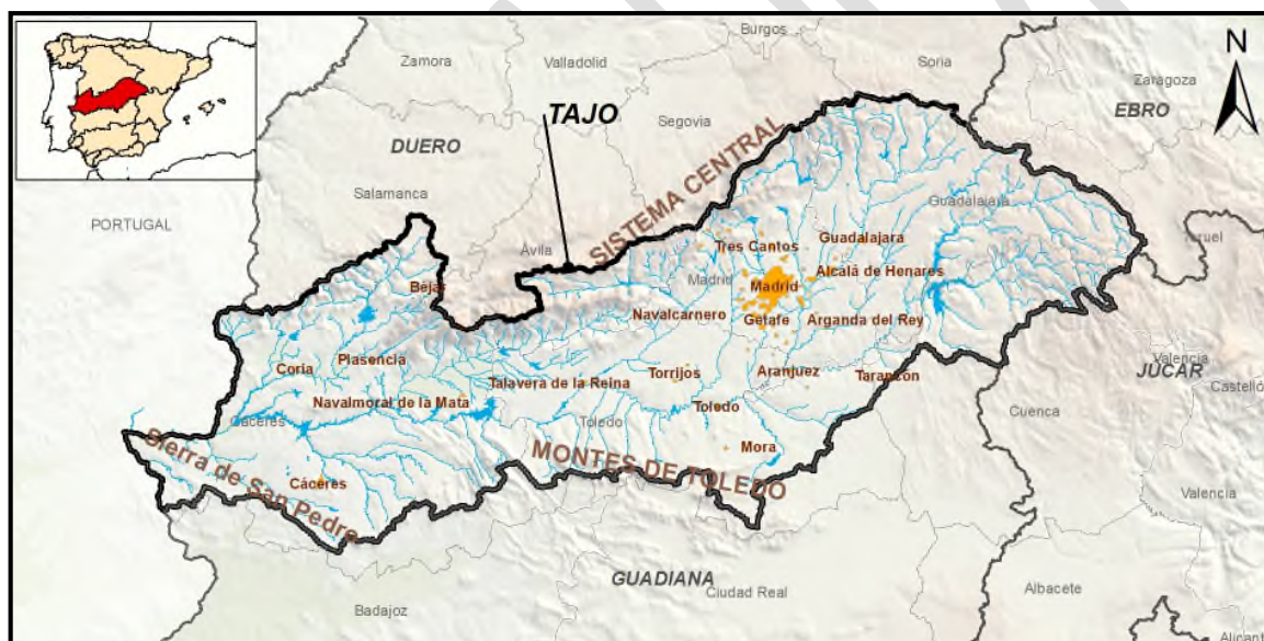
Figura 1. Ámbito geográfico de la parte española de la demarcación hidrográfica del Tajo.