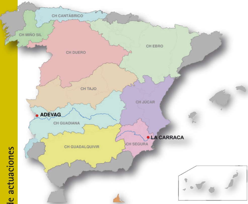
PROGRAMA DE VOLUNTARIADO EN RÍOS: Organizaciones con Proyectos en ejecución. Enero 2012

Servicio de publicaciones del MARM. NIPO 280-12-026-6