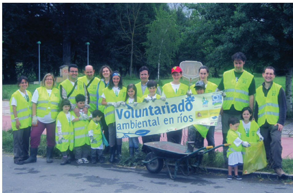
Fundación Oxígeno, con su proyecto voluntariado en ríos en las Lagunas de Gayangos observamos el Grupo Medina de Pomar. (Burgos)