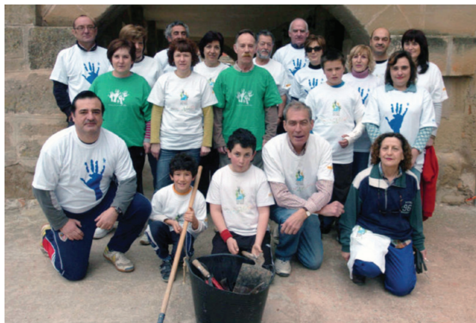
Asociación Socio Cultural Ciudad de Libia, (ASCL) han llevado a cabo la restauración ecológica de los ríos Tirón y Háchigo a su paso por el municipio de Herraméluri (La Rioja)