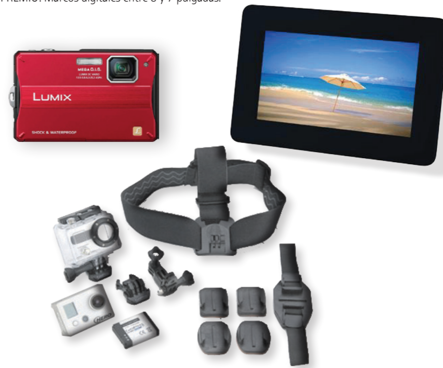
Las fotos son orientativas no tienen que responder a la realidad.

3º PREMIO: Marcos digitales entre 8 y 7 pulgadas.