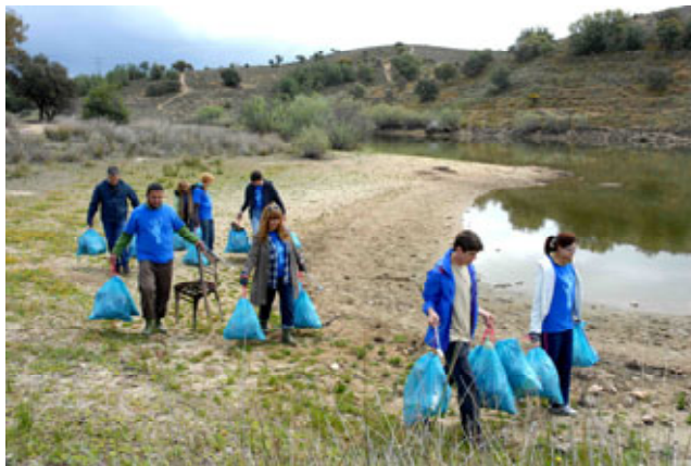
Retirada de residuos. La Portiña