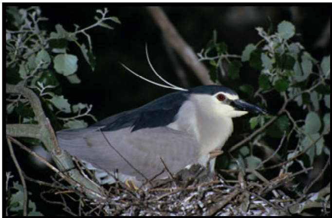
Martinete ( vulnerable )