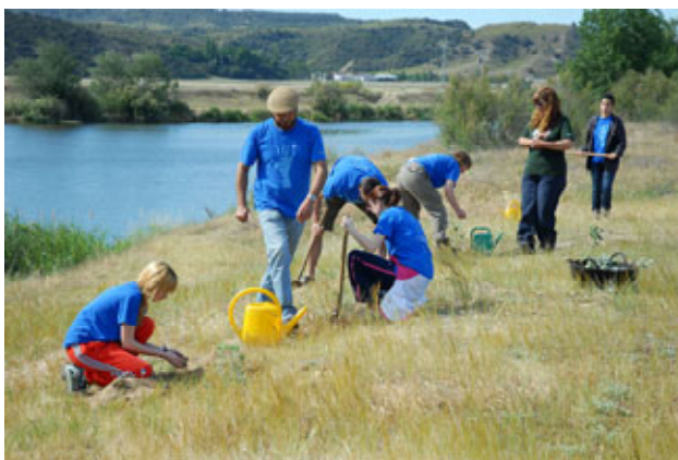
Plantación en Cabañuelas.