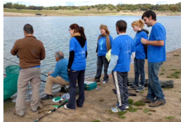
Concienciación de pescadores. Navalcán