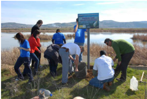
Puesta de carteles. Azután