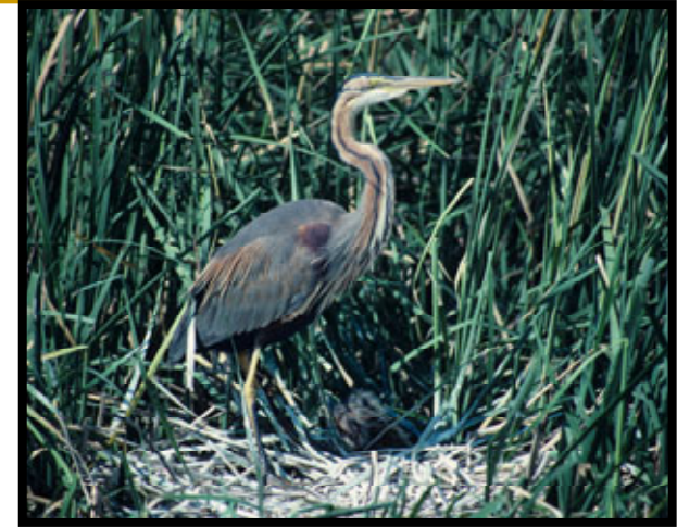
Garza imperial ( vulnerable )