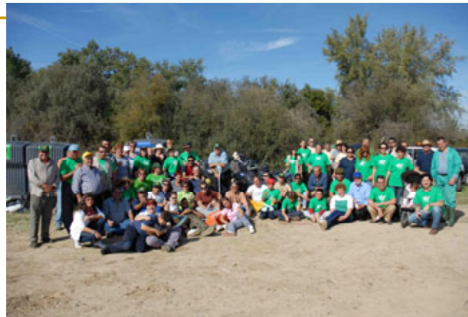
Tras la eliminación de residuos. Talavera la Nueva