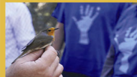
1º Premio en el II Concurso del Programa de Voluntariado en Ríos 2011

DE ABRIL A AGOSTO 2012 EN LA PROVINCIA DE TOLEDO