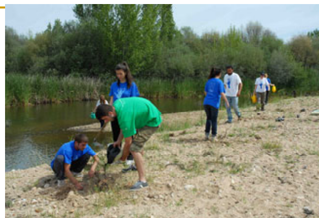
Plantación en el río Alberche