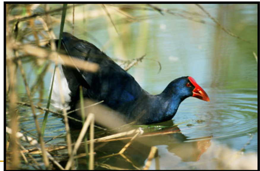
Calamón ( vulnerable )