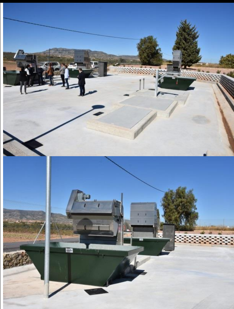
Planta de Pretratamiento de aguas pluviales en Pinoso (Alicante). Se ha desviado el colector de pluviales a la Planta de Pretratamiento donde se ha instalado un desbaste y una arqueta de sólidos donde se almacenará el residuo sólido, mientras que las aguas pluviales de escorrentía así tratadas serán devueltas al cauce del Rodrigillo. Octubre 2020.